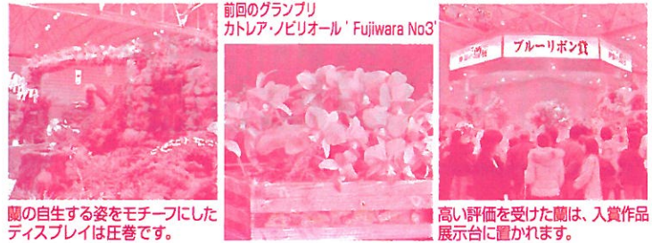
蘭の自生する姿をモチーフにしたディスプレイは狂喜です。