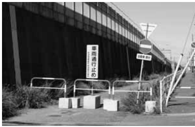
志田塗料店さん側