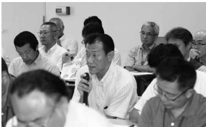
出席者による質疑・応答

開発委員会では新しい共同事業の1つとして共同配送事業を提案し、この事業運営に賛同いただいた新潟運輸さんの力添えを得て去る7月30日(木)NOCプラザ101号室にて説明会を開催しました。