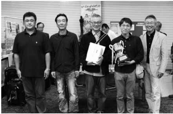
団体優勝のJR貨物チーム