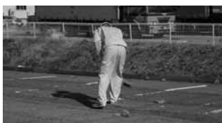
ライン引き作業風景

10月22日と10月27日に特にラインの薄くなっていたNo.4, 5, 6, 9, 10共同駐車場のライン引き工事を実施いたしました。11月中にはNo.12