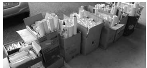
集まった多くのカレンダーと手帳

毎年、暮れに第5部会が行っているカレンダー・手帳の新潟市社会福祉協議会への寄付のご協力、誠に有難うございました。多くの品が集まり新潟市社会福祉協議会の方に大変、喜んで頂きました。