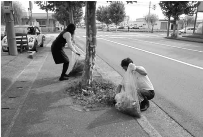
第2部会の清掃作業風景