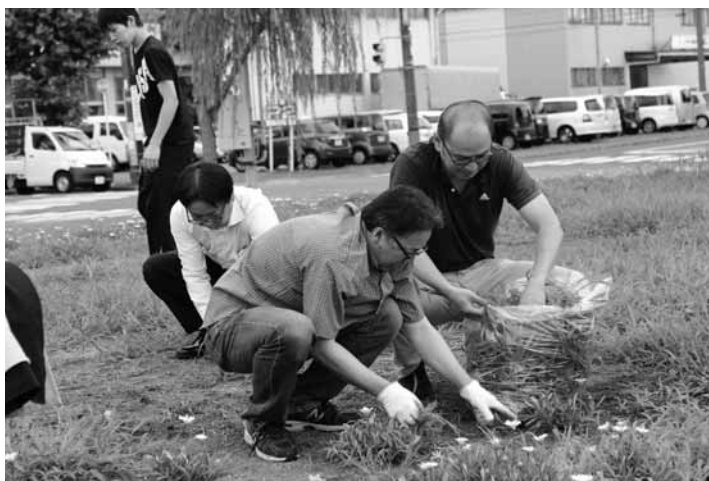
植栽後の除草、有難うございました