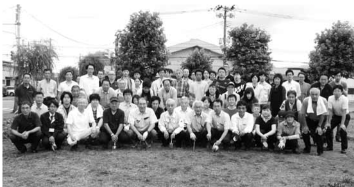
作業後皆さんでハイ!チーズ

7月7日の木曜日に三角地の植栽作業を行いました。今年は植栽を予定していたガザニアの苗600株が高温による育成不良のため、ウィンターコスモスという新しい品種を試験的に100株、植栽しました。