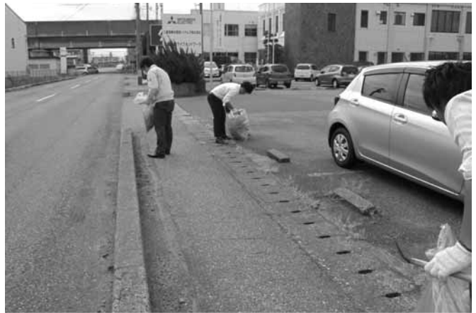
第7部会の清掃作業風景