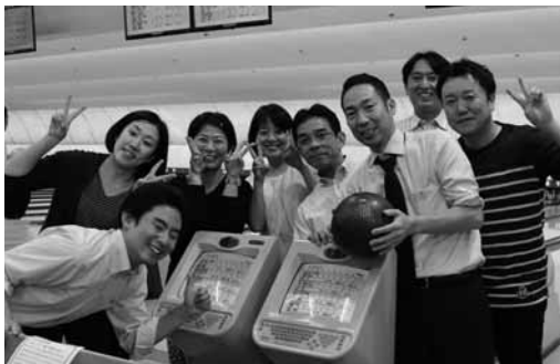
ハッピー・ボウリング!