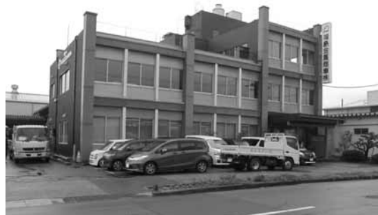
福島金属商事(株)さん全景