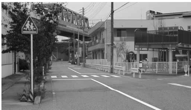
予定より早く新設したみたけ保育園前の横断歩道

かねてより新潟東警察署と新潟市東区役所においてお願いしておりました第8部会内みたけ保育園前道路への横断歩道の新設が行われました。当初12月に設置の予定でしたが、東警察署と新潟市東区建設課のご理解とご協力により10月に設置されました。