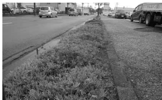
福島金属商事(株)さん前の植栽柵