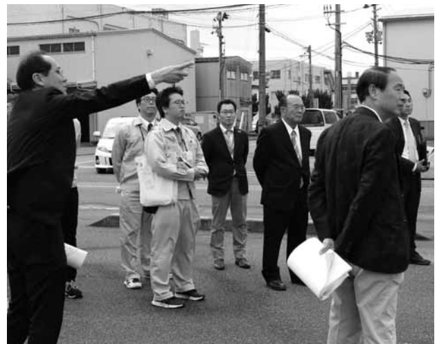
卸団地内見学の様子