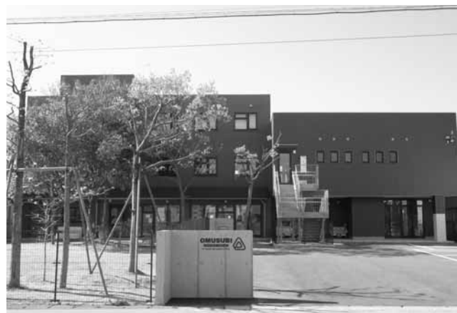
おむすびこども園の園舎

卸団地の中にあるおむすびこども園で、子ども達が活き活きと健やかに成長していけるよう、今後ご協力いただければ幸いです。