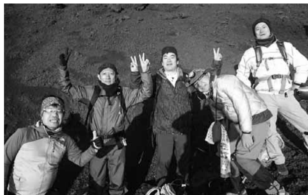
ご来光を仰ぐ青年部会員