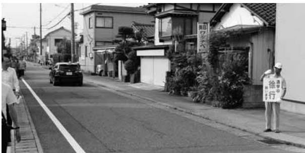
小路では毎朝ボランティアの方が通学時の徐行をお願いしています。

卸団地周辺の交通インフラ整備の改善について、新潟市、周辺自治会、関係機関、組合(開発委員会)で木戸地域交通対策検討会を実施しています。今回、木戸地域の課題を共有するため、現地見学会を7月18日(水)午前7時20分から開催しました。