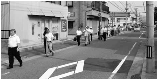
木戸地域の自治会関係機関とともに見学会を開催しました。