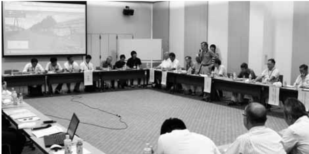
木戸地域を見学後、意見交換会が行われ、多くの自治会から山木戸逢谷内線の一方通行解除の要請がありました。

木戸地域の市道の中で一番幅員があります、市道山木戸逢谷内線(竹尾小～木戸小交差点)の一方通行の早期解除を自治会の皆さんと要請しました。