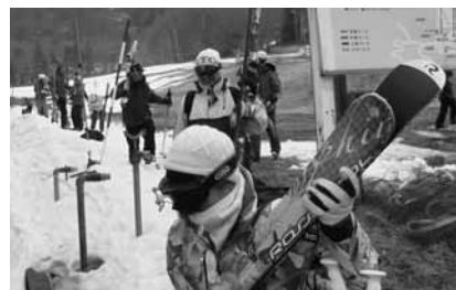
今年は小雪でした(猪苗代)

発行人 協同組合新潟卸センター(隔月発行) 新潟市東区卸新町2丁目853番地3 TEL(025)273-4181 FAX(025)270-6393 URL http://www.noc-plaza.com E-mail noc@noc-plaza.com