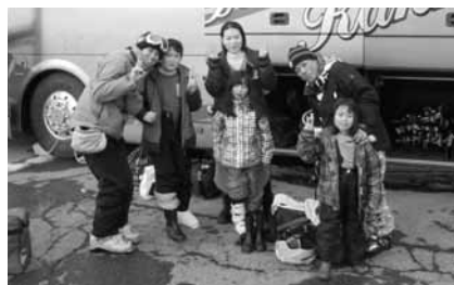
家族での参加(赤倉)