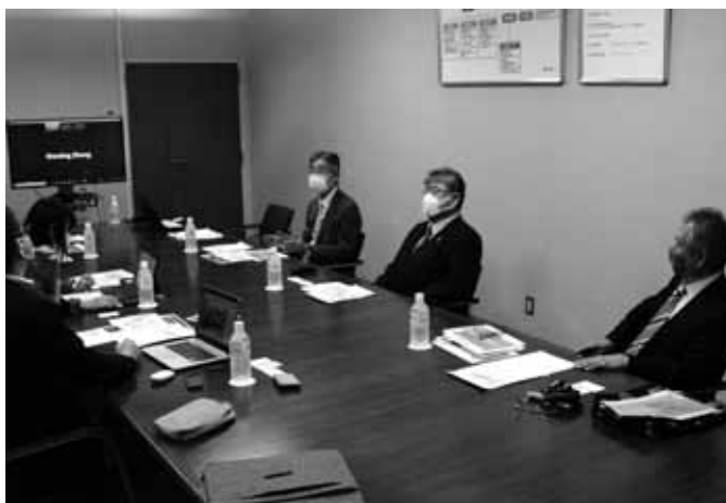
11月5日開催キックオフミーティング