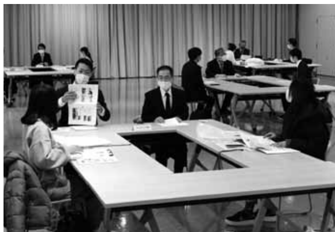
1月12日開催企業説明及び企業訪問

新潟大学の学生の皆さんに卸団地の企業を知ってもらうため、新潟大学経済科学部のご指導をいただき、令和3年11月5日(金)午後4時30分にリモートによるキックオフミーティングを開催しました。学生の皆さんに卸団地の歴史を説明したところ、大変興味を持ってもらいました。また、令和4年1月12日(水)午後2時からNOCプラザにおいて大学院生、学生の皆さんと参加企業による企業説明会及び企業訪問が実施されました。今回の交流を機に継続した取り組みを行っていきたいと考えております。