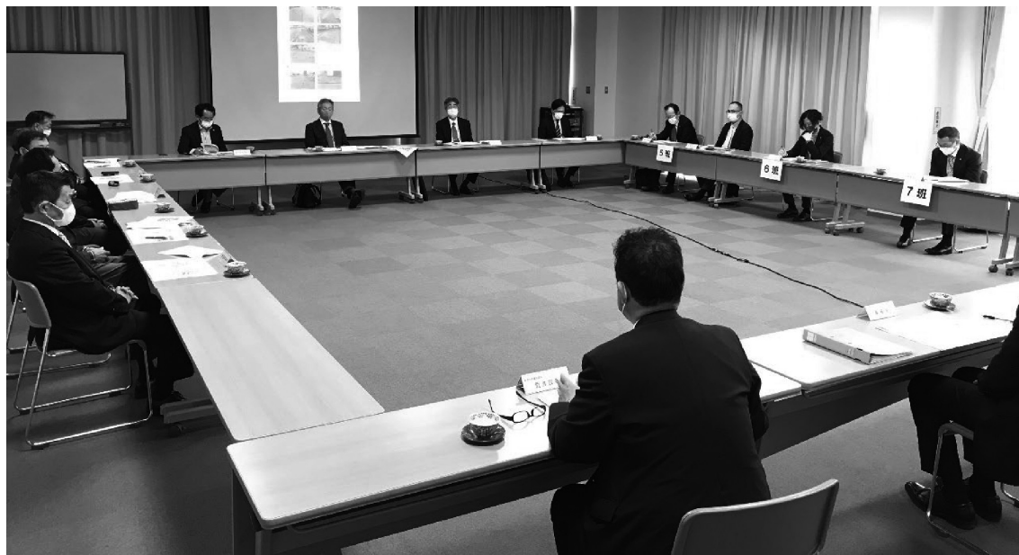
部会長、副部会長任期の1年延長を協議

令和5年4月21日(金)午後11時NOCプラザ101号室において令和5年度の部会活動についての話し合いが行われ次の通り決定しました。