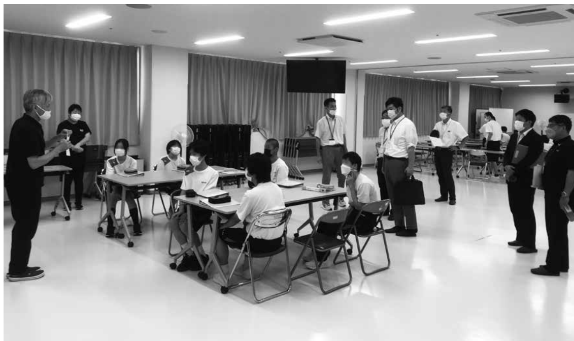
新潟よつば学園を見学