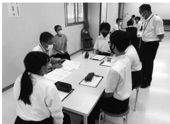
生徒の皆さんとディスカッション

卸団地に近接している新潟県立よつば学園の見学会を9月12日(火)午後1時15分に開催しました。よつばの由来は、もう教育部門・ろう教育部門・自立教育部門が併設され、保護者や地域の方々と一緒に成長する様を四つ葉に見立てています。生徒の皆さんは社会の中で自身の役割を見つけるため、様々な職種の取り組みを行っています。職場体験や、業務の依頼等、事業生活の参加を望まれていることから、青年部会会員が学園を見学し、生徒の皆さんと仕事に取り組むためのディスカッションが行われました。