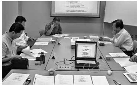
環境委員会の様子