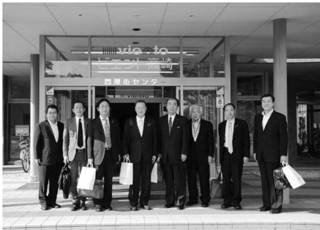
高崎卸商社街(協)玄関先で

を目指すことにしており、このことから5月28日(月)に先進組合である高崎卸商社街(協)の視察を行いました。