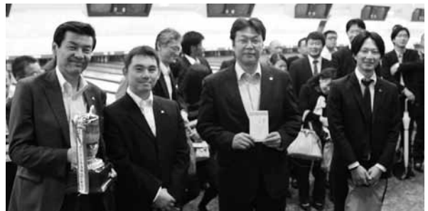
団体優勝のインネットチーム