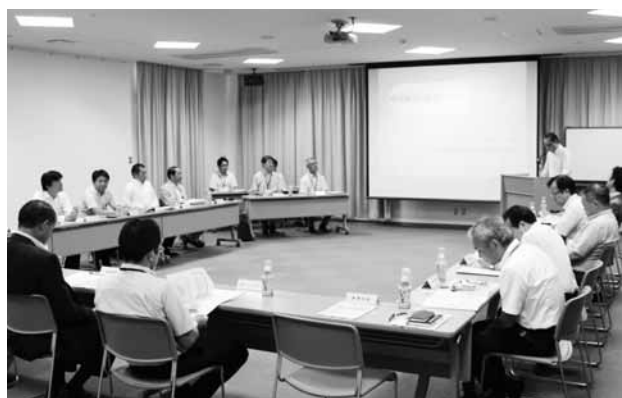
組合役員・開発委員に説明

新潟市による、「紫竹踏切」の改善説明会が、平成25年8月22日(木)午後3時30分、NOCプラザ103号室で開催されました。