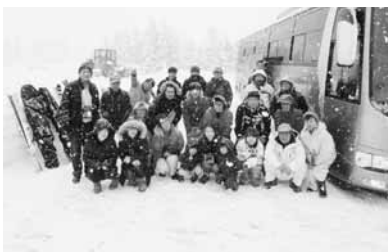
舞子スノーリゾート