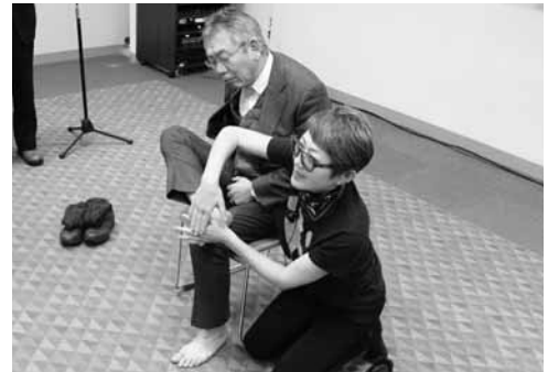
転倒防止の実演の様子