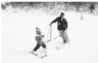
猪苗代スキーリゾート

今年度も2回のスキー・スノボツアーを敢行致しました。1回目は1月21日(日)猪苗代スキーリゾート、2回目は2月18日(日)舞子スノーリゾート(石打)で行いました。お子さんから大人まで皆様、楽しんだ様子であり充実したツアーとなりました。