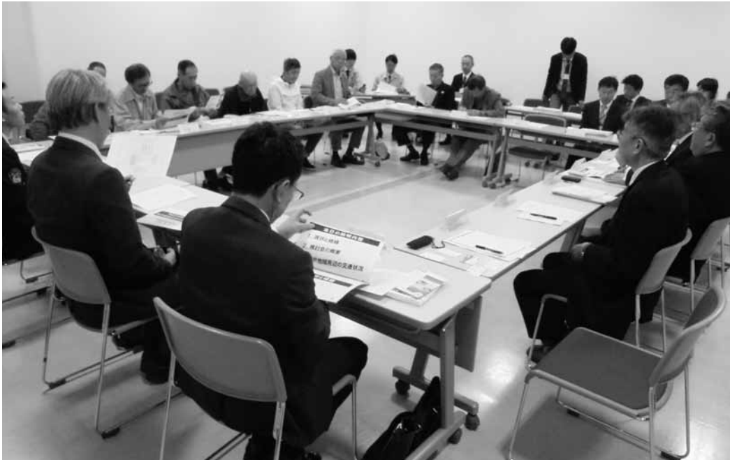
木戸地域交通対策検討会の様子

開発委員会では、卸団地周辺の交通アクセスのインフラ整備改善について、新潟市と勉強会を重ねてきておりますが、卸団地周辺地域の交通対策として、「木戸地域交通対策検討会」を平成30年4月26日(木)午後2時、東区役所において開催され、周辺自治会、関係機関、組合が出席しました。検討会では、市道山木戸逢谷内線(木戸小学校から竹尾小学校間)の一方通行解除と新潟バイパス下の横断ボックスの拡幅について意見交換を行いました。