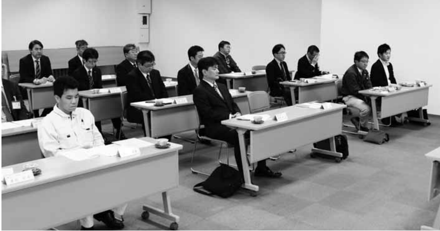
青年部会通常総会風景

総会では、事業実績・決算、事業計画・収支予算を審議し、満場一致で承認されました。