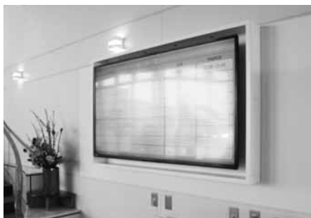
デジタル・サイネージ(電子看板)

NOCプラザの新しい顔になると思いますので、組合員の方々のより一層のNOCプラザのご利用をお待ちしております。