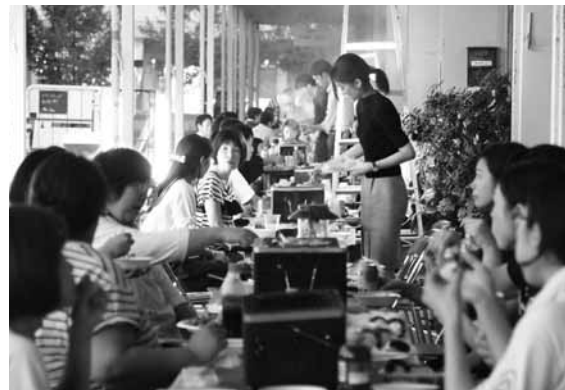
お肉も充実していました(4班)

地域別部会では、納涼会やBBQ大会を実施しておりますが、今年は2班の皆さんが8月23日、NOCプラザセンターガーデンで、4班の皆さんが8月30日、4班のエリア(ジョーセンさん・丸惣さん・オフィスさん前)でBBQ大会を開催されました。8月下旬は雨の日が多く準備も大変でしたが、両日とも夕方には雨も上がり無事に懇親がはかられました。