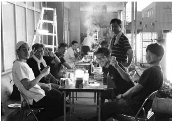
4班の皆さんも和気あいあい(参加者10社53名)