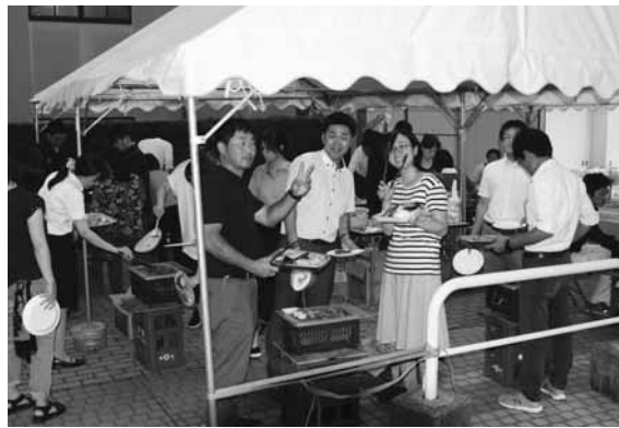
2班の皆さんはテントを張って行いました(参加者9社42名)