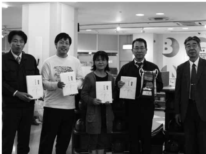
優勝 (株)サンエスフィッティング