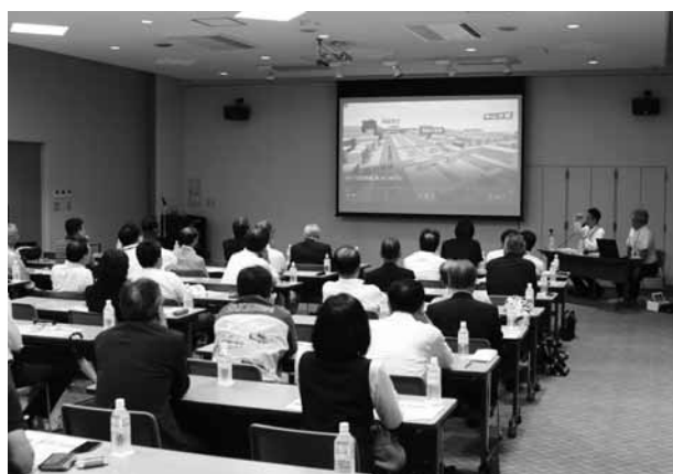
プロジェクター・VRを使って説明会を行いました。