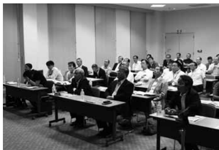
組合員の皆様から48名の参加を いただきました。