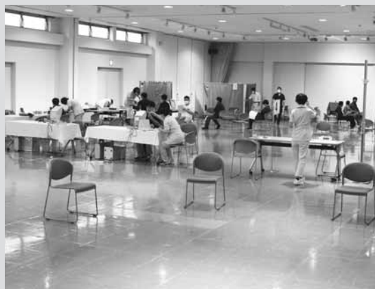
健康診断も間隔を空けて行っております。