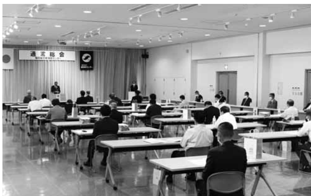
総会では新生活様式での対応を取りました