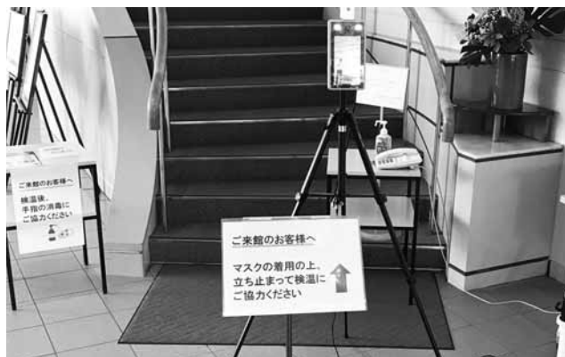
検温器を設置いたしました