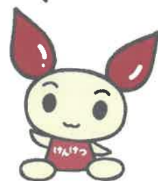
献血キャラクター