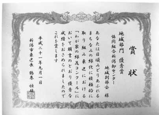
新潟市東区長より優秀賞をいただきました。

発行人 協同組合新潟卸センター (隔月発行) 新潟市東区卸新町2丁目853番地3 TEL (025) 273 - 4181 FAX (025) 270 - 6393 URL http://www.noc-plaza.com E-mail noc@noc-plaza.com