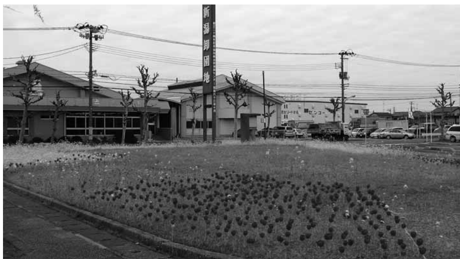
応募した三角緑地

地域別部会第4班が中心となって緑化活動をしている三角緑地の写真を、わが家の緑花コンクールに応募したところ、東区の地域部門の優秀賞を受賞しました。今後、市の8つの区の最終審査を受けることとなりました。