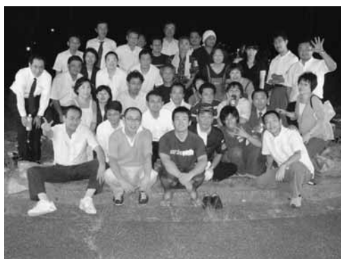
花が咲いたころ花見会をひらいています。

地域別部会第4班が中心となって緑化活動をしている三角緑地の写真を、わが家の緑花コンクールに応募したところ、東区の地域部門の優秀賞を受賞しました。今後、市の8つの区の最終審査を受けることとなりました。